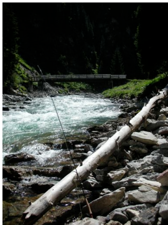
Der Lechbach unter dem Gasthaus Bodenalpe, ein wilder Gebirgsbach von bezaubernder Schönheit...