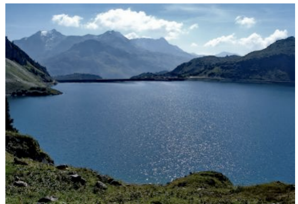
Der Spuller, ein traumhaft schöner Hochgebirgssee.

Tageskarte: €27 Entnahme: 6 Fische/Tag Schonmaß: 26 cm für alle Fischarten Saison 2010: 12. Juni bis 24. Oktober