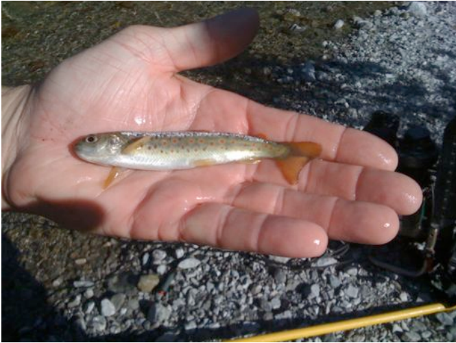
Eine wunderbar gezeichnete ca. einjährige Urforelle aus dem Schongebiet.