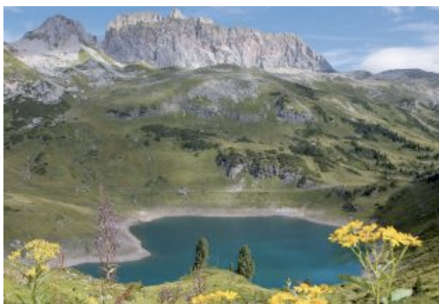
Der Formarinsee auf 1789m Seehöhe.