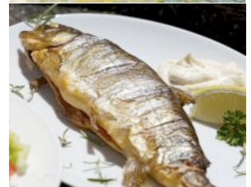
Der Fischteich in Zug, ideal für Einsteiger!