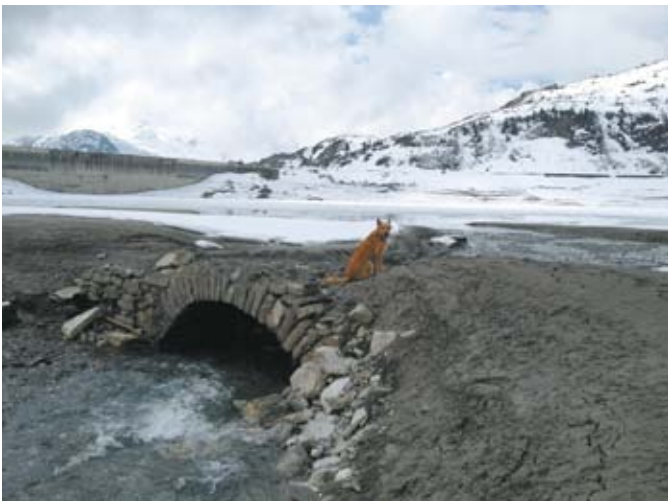
Die alte Alpbrücke am Spullersee, die trotz unzähliger vergangener Aufstauungen immer noch intakt ist.